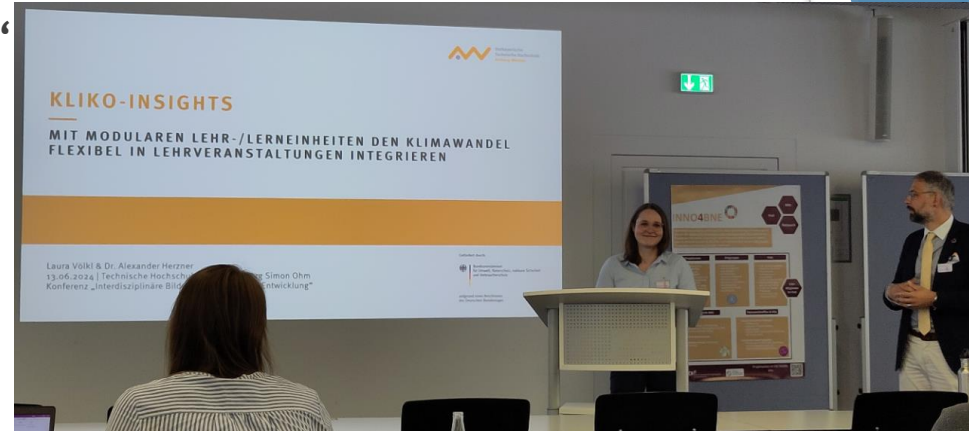
Lehrbeispiele auf der I-BNE-Konferenz u.a. von KLIKO-INSIGHTS, zu ESDGS sowie Kreislaufwirtschaft

Wenn Sie mitmachen wollen, kontaktieren Sie die Thematische Koordinationsstelle für Transfer .